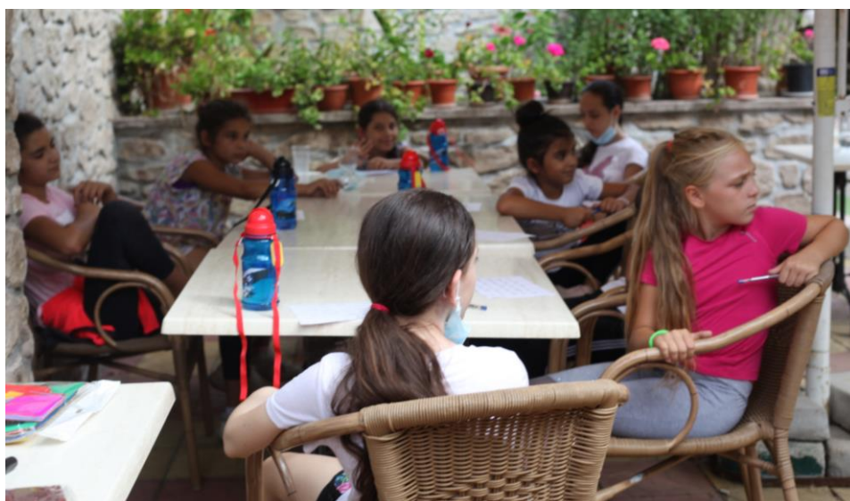
Camp d'été 2020

Pourtant très menacé par la pandémie, le camp d'été a finalement pu avoir lieu, du 31 août au 5 septembre. La dépense est principalement constituée de l'hébergement et la pension des 31 enfants et de l'équipe encadrante à l'hôtel Ciuta à Buzau (22 500 lei) et de leur transport (3 300 lei). Le thème du camp « Running for tomorrow » a été mené avec l'aide de l'association ASCENDIS (coût : 3 000 lei – compté en « aide psychologique »). Cf. infra pour le financement du camp.