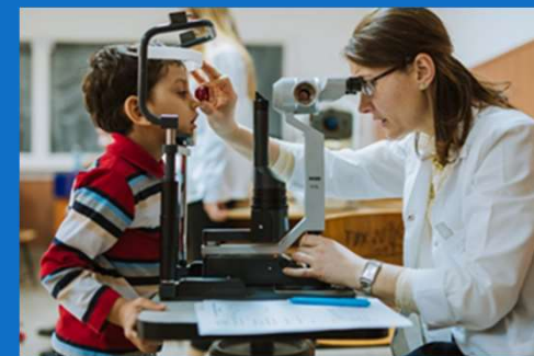
20/01 : Séances de dépistage avec la « Caravane des Médecins »