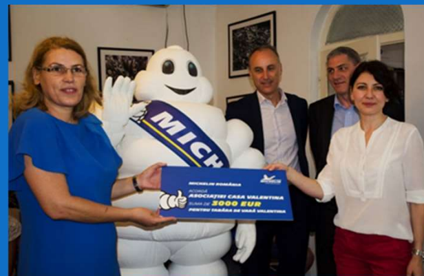
19/06 : Visite de Michelin, sponsor du camp d'été