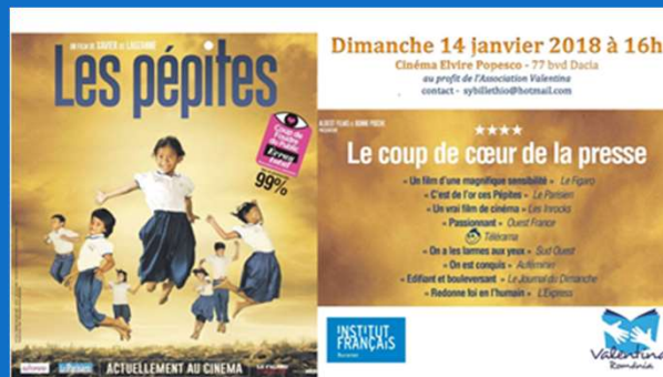
14/01 : Projection caritative « Les Pépites » à l'Institut Français