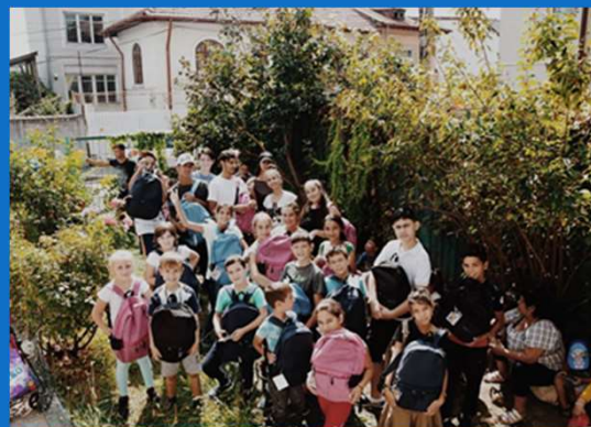
17/09 : Distribution des kits scolaires pour la rentrée avec le Muguet de l'espoir