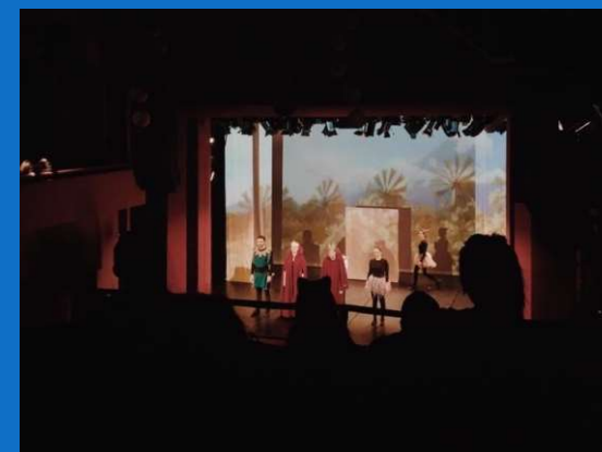
25/11 : Sortie au Teatrul Excelsior-Praslea cel voinic si merele de aur