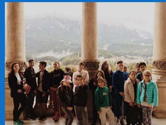
28/06 : Visite du Palais Cotroceni