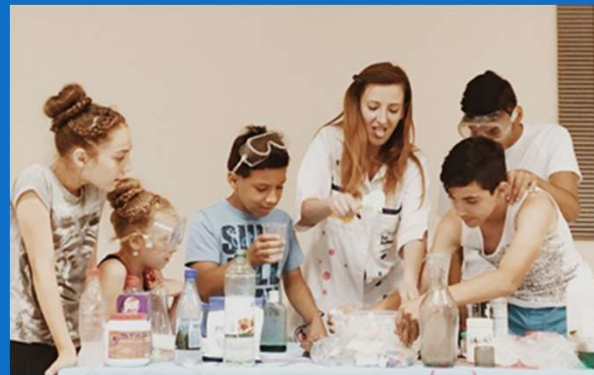
14/06 : Atelier de Chimie organisé par CORA