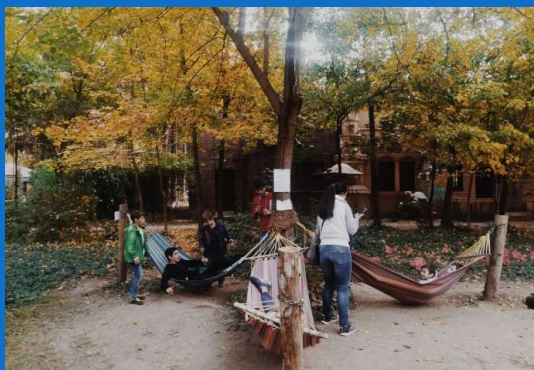
20/10 : Sortie au Zoo