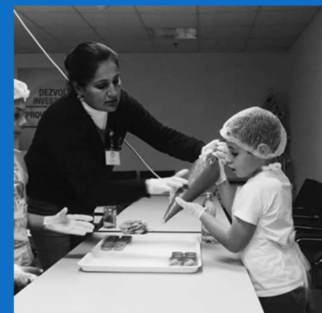
10/12 : Atelier de confiserie organisé par CORA