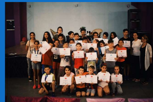
16/07 : Remise des diplômes « I am a champion »