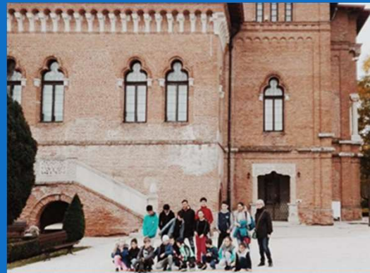
03/11: Sortie au Parc Mogosoia