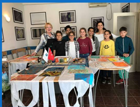
10/02 : Atelier créatif à la Casa