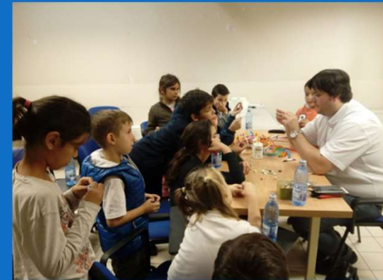
19/10 : Atelier de Quilling organisé par CORA