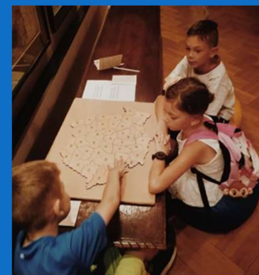
21/09 : Visite du Musée National al Hartilor si Cartii Vechi