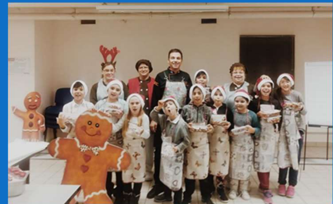
10/11 : Atelier de pâtisserie organisé par CORA