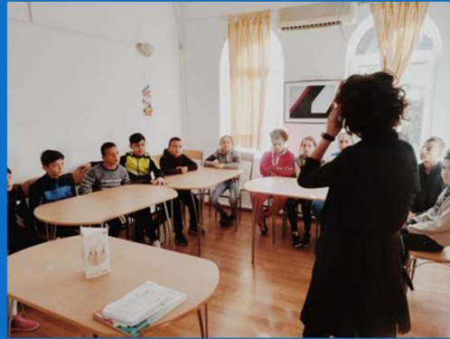
27/09 : Cours d'hygiène dentaire avec SENSODYNE