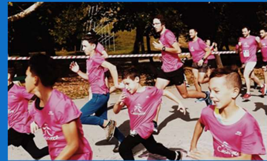
29/09 : Deuxième participation des enfants à la course Casiopea