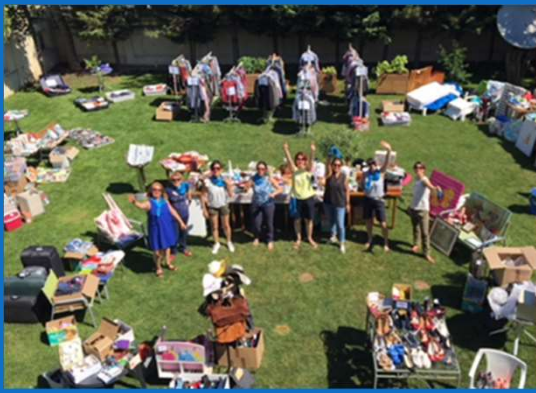
Vide-grenier caritatif du Printemps