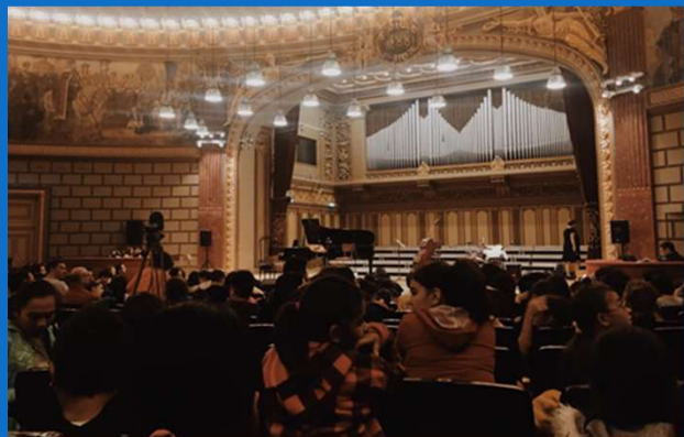
08/12 : Sortie à l'Athénée pour le programme "Clasic & Fantastic"