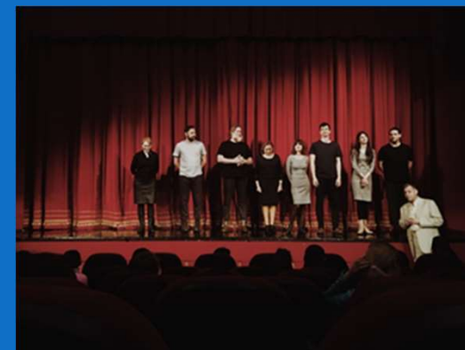
24/03 : Sortie au Théâtre Excelsior – Povestea porcului