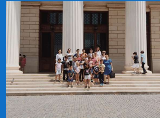
17/06 : Sortie à l'Athénée – Programme "Clasic & Fantastic"