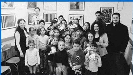
10/01 : Rencontre et Activités avec les salariés de Autonom