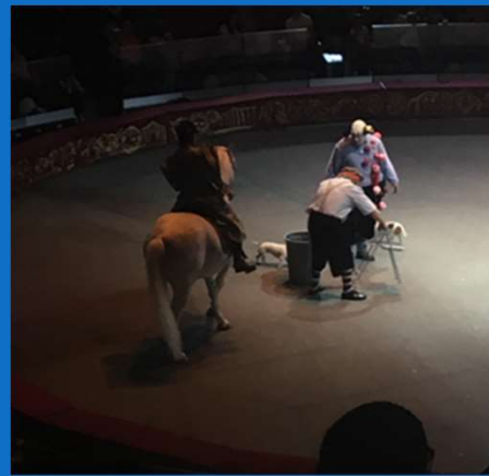
20/05 : Sortie au Cirque Globus