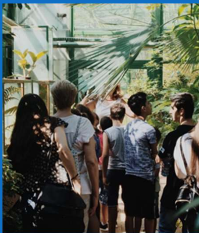
06/07 : Visite du jardin botanique