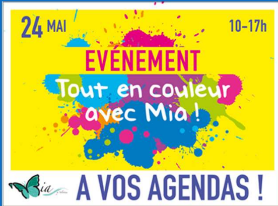
24/05 : Evénement annuel de l'atelier MIA « Tout en couleurs »