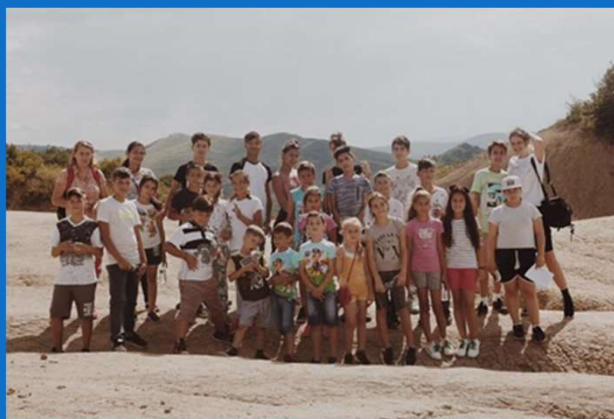
Du 11 au 16/07 : Camp d'été à Buzau sur le thème « I am a champion »