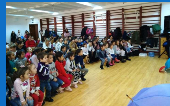
15/12 : Fête de Noël pour les 100 enfants de Valentina