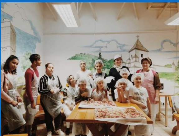
07/11 : Atelier de fabrication de pizza organisé par CORA