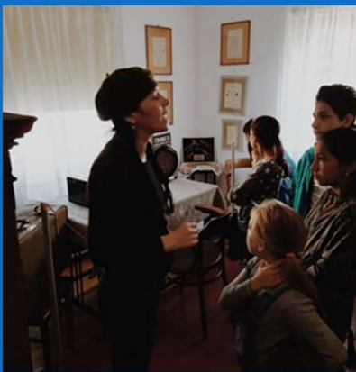
05/10 : Rencontre avec le romancier Tudor Argezi