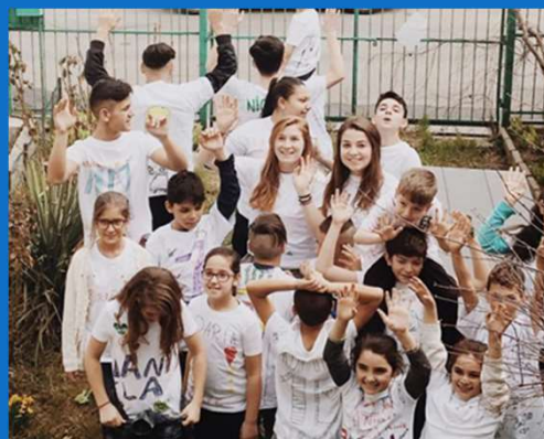
17/03 : Activités avec l'association étudiante Bucar'help de Lille