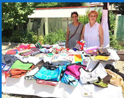
27/06 : Vente de l'été de l'atelier MIA