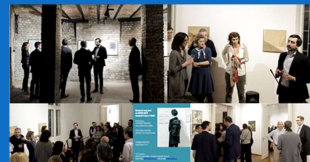
09/03 : 1 er Apéro-Artis pour lever des fonds avec la découverte de la Galerie d'art EASTWARDS PROSPECTUS,