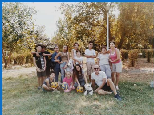
15/09 : Pique nique de rentrée dans le Parc Tineretului