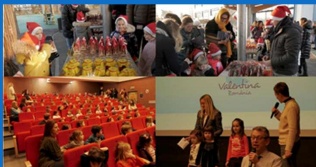
25/01 : Remise de la recette du Marché de Noël par les enfants du Lycée Français