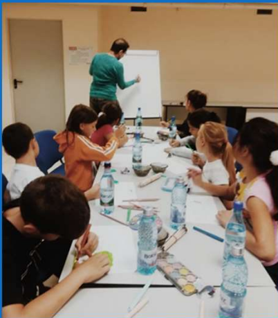
26/09 : Atelier de peinture organisé par CORA