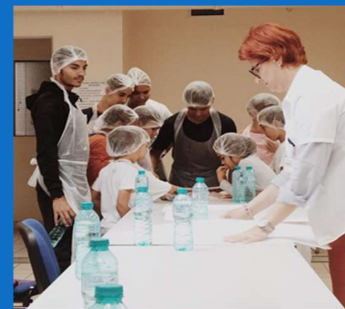
23/05 : Atelier de Cuisine organisé par CORA