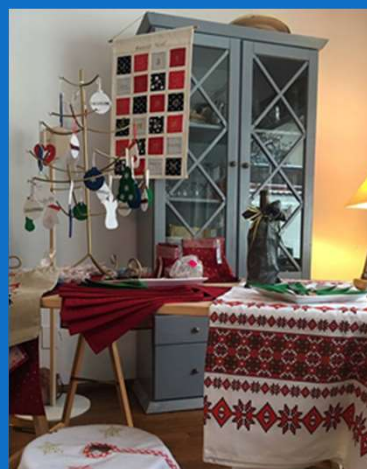
Noël : Lancement de la nouvelle collection MIA pour les ventes de fin d'année