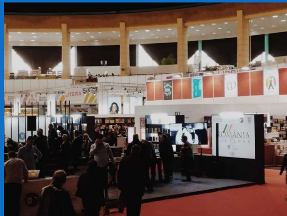
14/11 : Sortie au marché International Gaudeamus à ROMEXPO