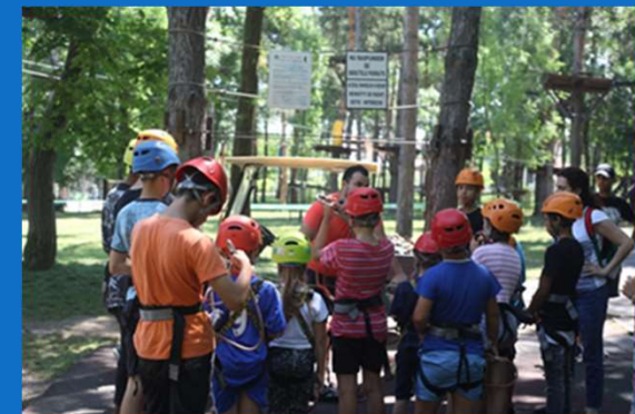
22/06 : Sortie Accrobranche dans le Parc de Comana