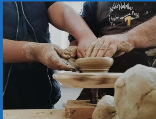
08/10 : Atelier de poterie organisé par CORA