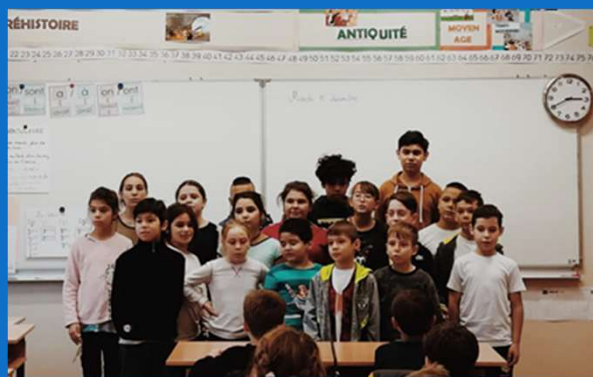
12/12 : Echanges avec les élèves du Lycée Français Anna de Noailles