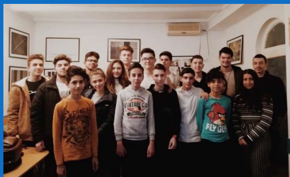
13/12 : Visite des élèves du Lycée Kretzulescu