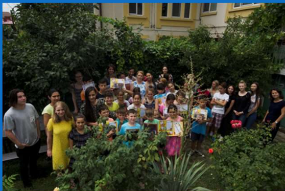
18/06 : Fête de fin d'année scolaire